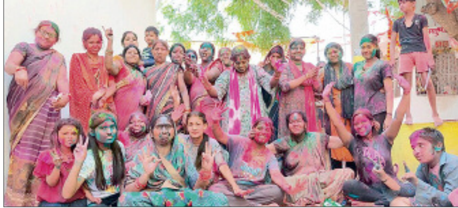
हरीभूमि न्यूज ▶▶ महासमुंद

शंकर नगर महासमुंद में स्थित कुंदकेश्वर महादेव मंदिर प्रांगण में बड़े उल्लास पूर्वक होली पर्व मनाया गया। होली के 1 दिन पूर्व मोहल्ले वासी मंदिर के सामने होलिका दहन किए। होलिका दहन में पूजा पाठ के पश्चात सभी बुराइयों को होलिका