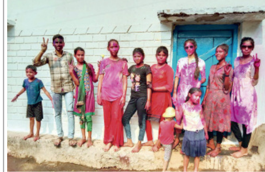
महासमुंद। ग्राम बम्हनी में पारंपरिक रीति रिवाजों के साथ रविवार ककी रात्रि 11.15 बजे होलीका दहन करने के बाद सोमवार को हवैलास एवं आचार सहिता को ध्यान में रखते हुए शांतिपूर्वक तरीकों से होली उत्सव मनाया गया है।